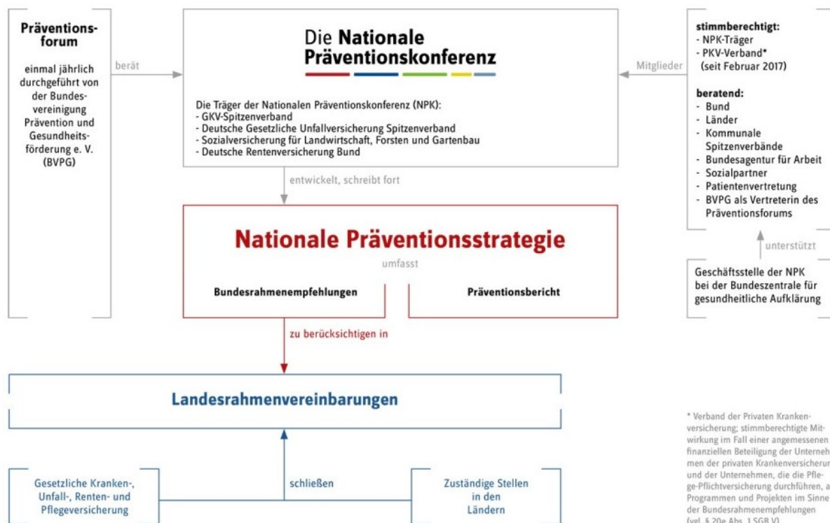
Abb. 2: Die Nationale Präventionsstrategie

Beratend für die Nationale Präventionskonferenz tagt einmal jährlich das von der Bundesvereinigung Prävention und Gesundheitsförderung e. V. (BVPG) durchgeführte Präventionsforum, welches einen Austausch der NPK mit der Fachöffentlichkeit zu wechselnden Themen ermöglicht (§ 20e Absatz 2 SGB V). Beim Präventionsforum 2024 lag der Fokus auf „Gesund aufwachsen: Transitionen in Kindheit, Jugend und frühem Erwachsenenalter“. 83